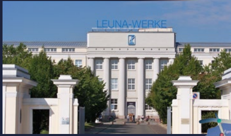
Leuna - Standort der Chemieindustrie

Der Saalekreis ist meine Heimat: eine Kulturlandschaft mitten in Deutschland. Kirchen, Burgen und Schlösser künden von seiner großen Vergangenheit. Salz, Kohle und gute Böden schufen unseren Wohlstand. Der Bergbau, die Chemie und der Maschinenbau gaben den Menschen gute Arbeit. Mit Fleiß und Ideen machen wir jetzt den Saalekreis fit für die Zukunft.