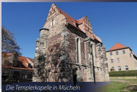
Die Templerkapelle in Mücheln

„An der Saale hellem Strande stehen Burgen stolz und kühn...“