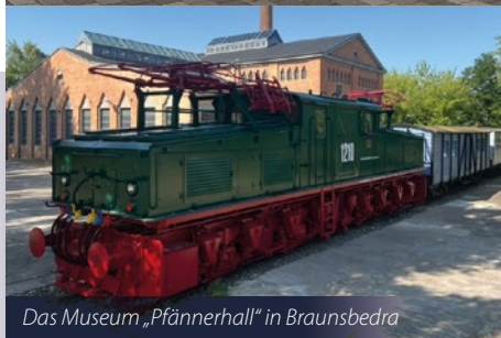
Das Museum „Pfännerhall“ in Braunsbedra