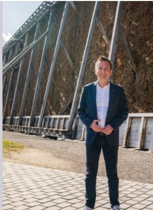
Das Gradierwerk in Bad Dürrenberg