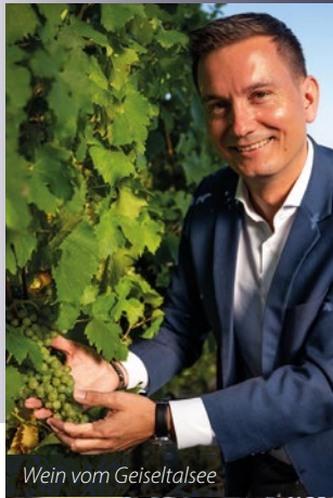
Wein vom Geiseltalsee