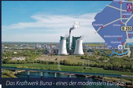
Das Kraftwerk Buna - eines der modernsten Europas