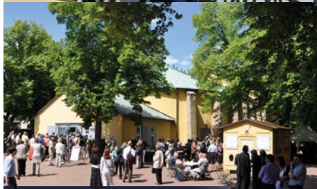
Das Goethe-Theater in Bad Lauchstädt