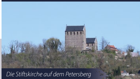
Die Stiftskirche auf dem Petersberg