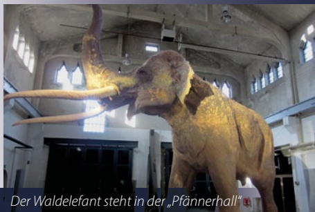
Der Waldelefant steht in der „Pfännerhall“