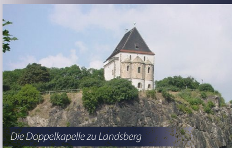
Die Doppelkapelle zu Landsberg