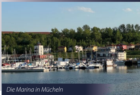
Die Marina in Mücheln