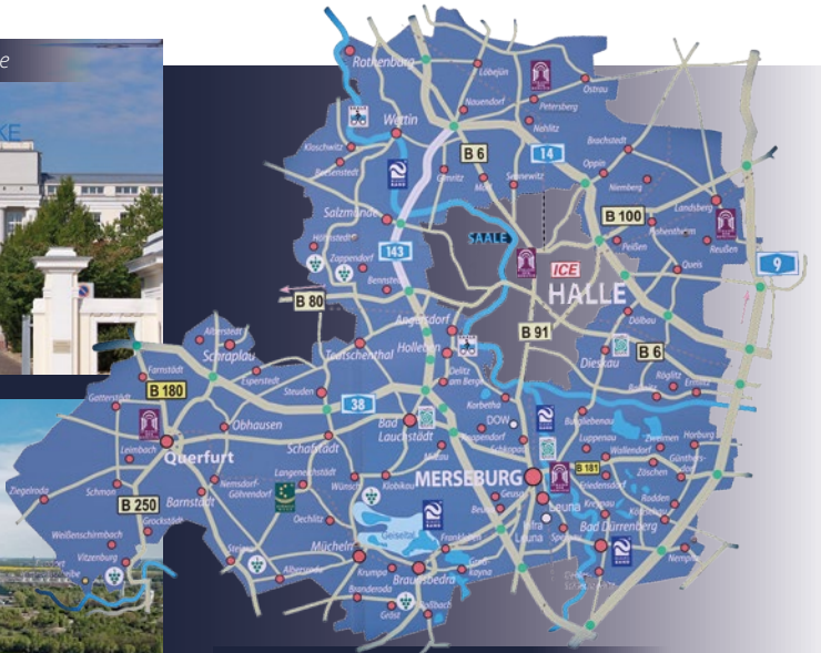
Der Saalekreis umschließt die Großstadt Halle (Saale)