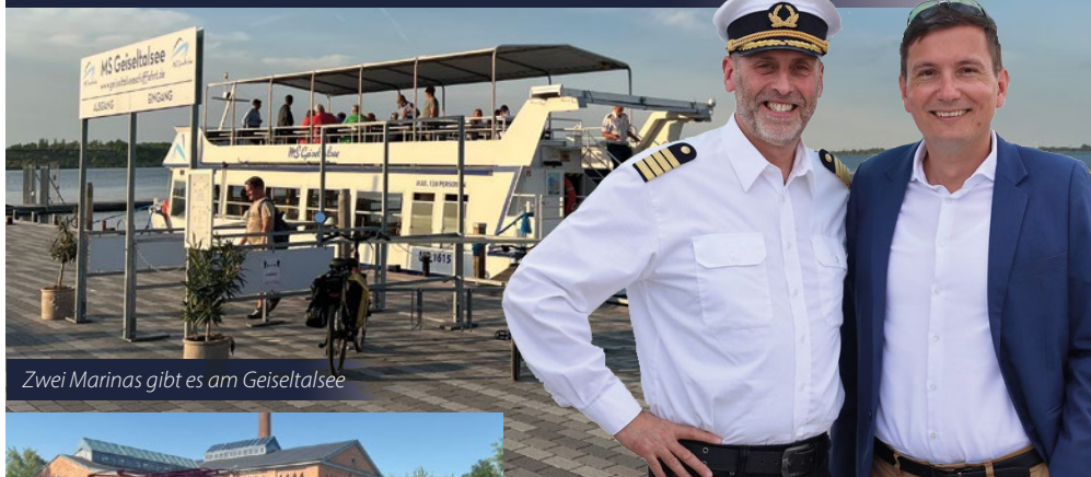
Zwei Marinas gibt es am Geiselalsee