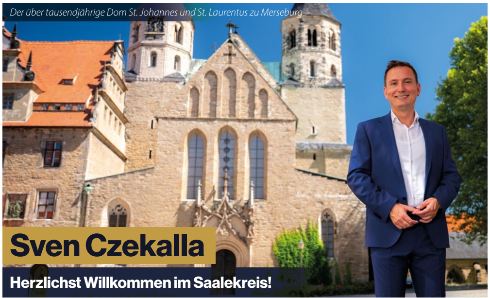
Der über tausendjährige Dom St. Johannes und St. Laurentius zu Merseburg